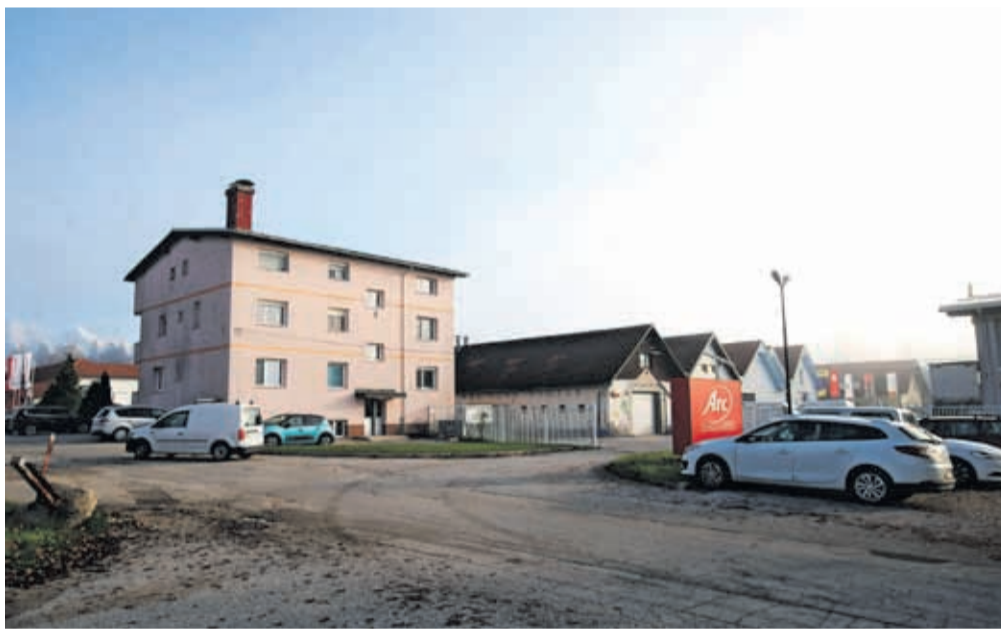
V Poslovni coni Hrastje je trenutno devetnajst podjetij.

»Poslovna cona Hrastje je največji razvojno-investicijski projekt MOK v zadnjih desetletjih. To je edina cona, ki ima možnost večje širitve. Zato je to za nas zelo pomemben mejnik. Zanimanje za komunalno opremljena zemljišča je veliko, saj je po nam znanih podatkih polovica zemljišč že prodana,« je dejal župan Matjaž Rakovec.