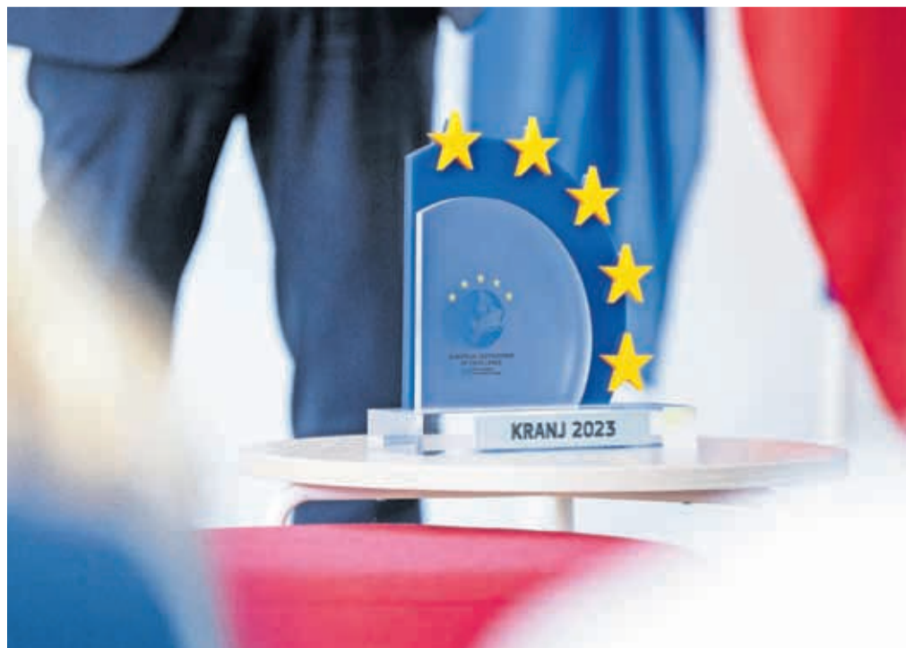
Kranj v letu 2023 nosi naziv evropska destinacija odličnosti, ki mu ga je podelila Evropska komisija.