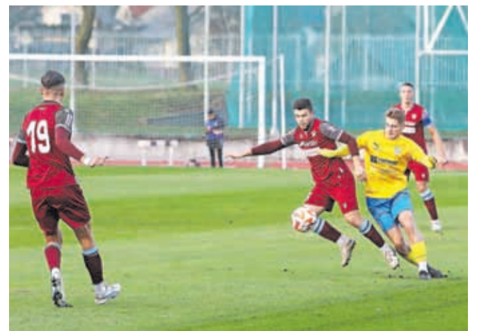
Nogometaši Triglava so na zadnji tekmi jesenskega dela na domači zelenici premagali goste iz Beltincev.