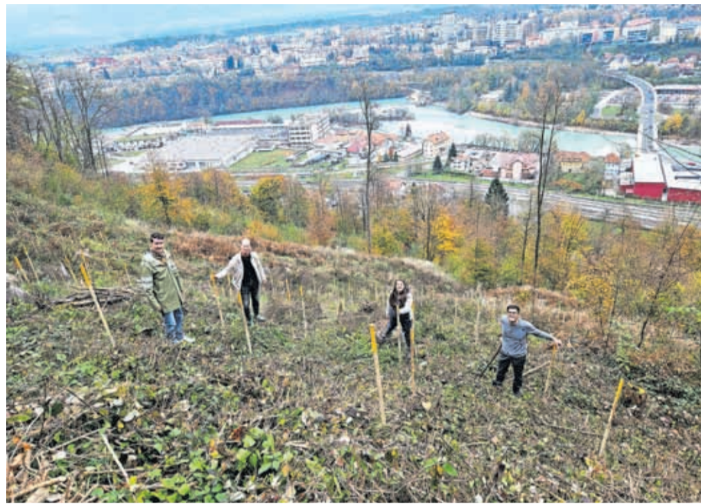
Na pobočju Šmarjetne gore, na območju, ki sta ga načela žledolom in lubadar, je Mestna občina Kranj zasadila tristo sadik oreha, divje češnje, pravega kostanja in lipe.

Tretje leto zapored so občanke in občani vseh 26 krajevnih skupnosti imeli možnost predlagati projek-