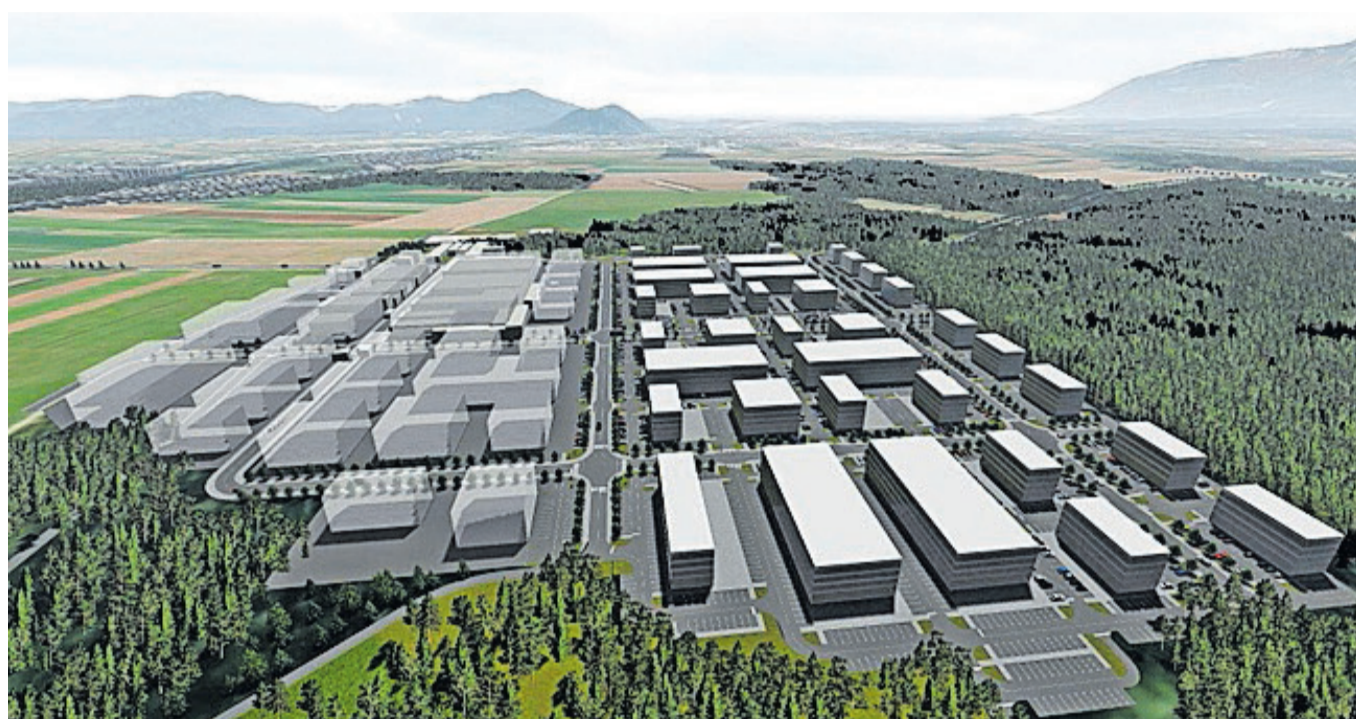
Mestna občina Kranj je pridobila pravnomočno gradbeno dovoljenje za gradnjo javne infrastrukture v Poslovni coni Hrastje. Na sliki vizualizacija cone.

Na občini so tudi v letu 2023 utrjevali položaj Kranja v misiji 100 podnebno nevtralnih in pametnih mest do leta 2030. MOK je zgradila prvo parkirišče P + R (parkiraj in prestopi) na Gorenjskem s 56 parkirnimi mesti,