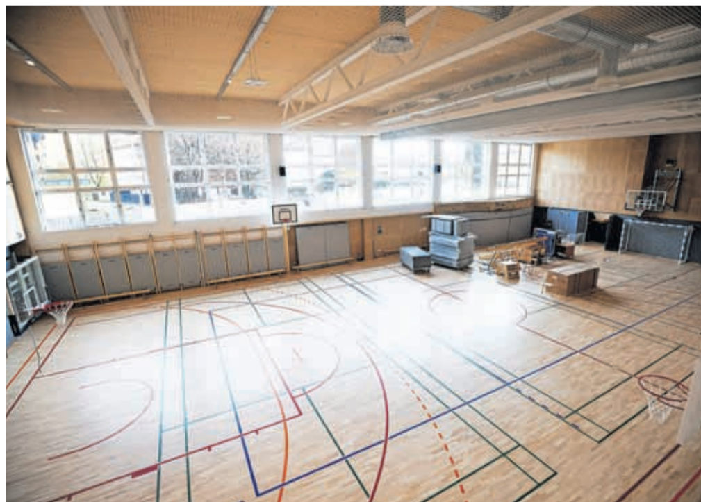
Na področju šolstva izstopa gradnja in opremljanje prizidka k OŠ Staneta Žagarja Kranj.

Nova turistična pridobitev v Kranju je od letos Jenkova rezidenca v starem mestnem jedru, v kateri je nekoč bival Simon Jenko. Ta ohranja kulturno dediščino, hkrati pa poudarja trajnostne smernice bivanja. Za trajnostni razvoj v turizmu je Kranj letos prejel platinasti znak, najvišji v okviru zelene sheme slovenskega turizma. Info center SOS proteus, v katerem biologi Zavoda Jamski laboratorij Tular izobražujejo obiskovalce o človeški ribici in pomenu podzemnih voda, se je uvrstil