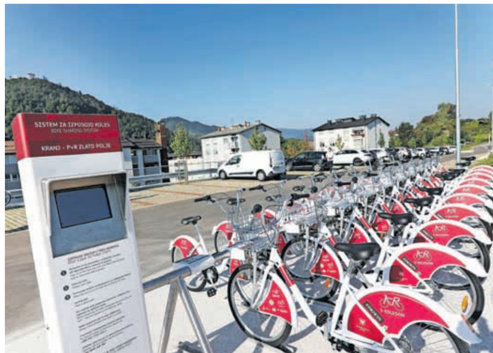
Na parkirišču P + R na Zlatem polju s 56 parkirnimi mesti je tudi novo postajališče sistema KRskOLESOM.